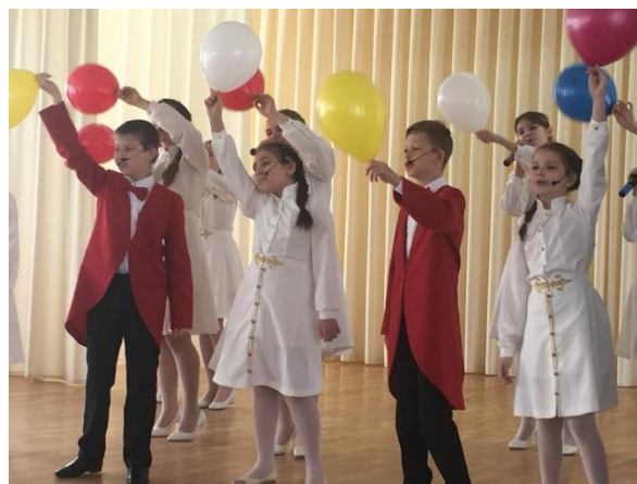
Учащиеся МБУ ДО «Детская школа искусств № 1» - ансамбль скрипачей «Концертино»

Цель Фестиваля: непрерывное совершенствование уровня педагогического и профессионального мастерства учителей, их эрудиции и компетентности в области технологии и методики преподавания, достижения качества образования, соответствующего современным требованиям.