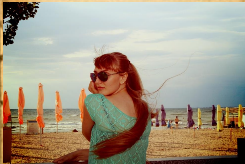
Краснодарский край город Анапа.