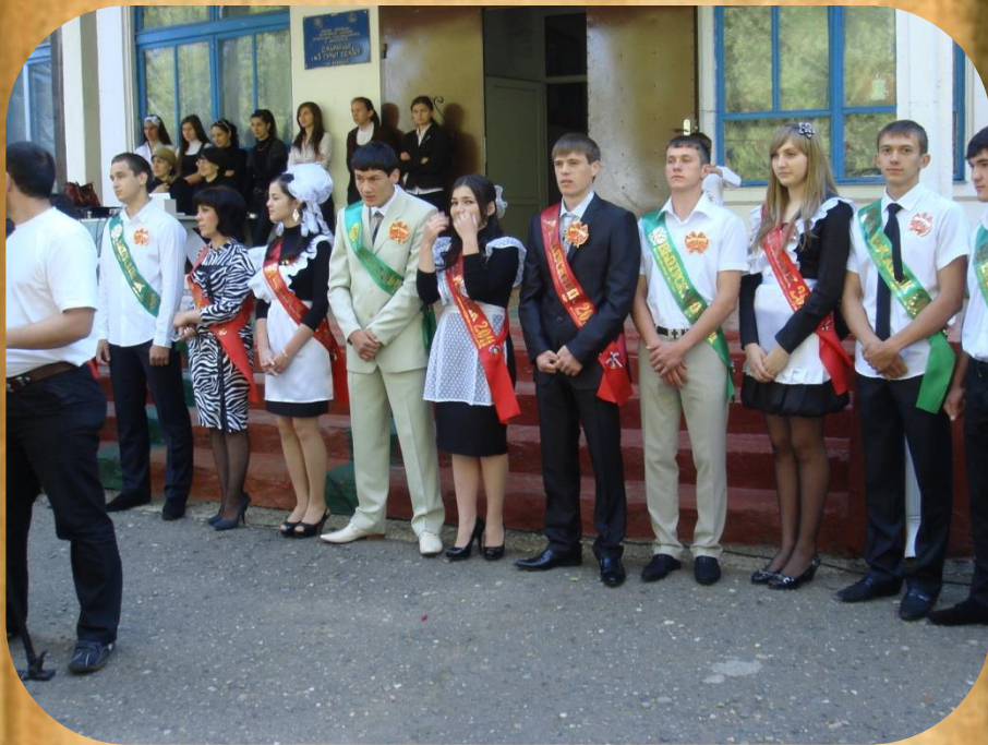
Выпуск 11 класс..