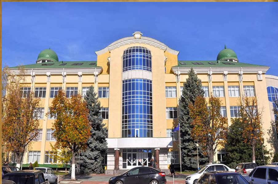
Адыгейский государственный университет.