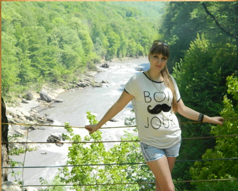
Республика Адыгея Водопады Руфабго.