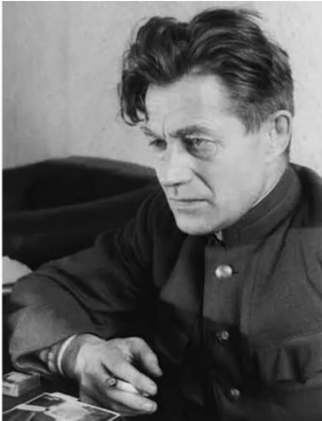
Алексей Александрович Сурков (1899- 1983 гг.) Песни «Песня смелых», «Землянка» (1941) Сборники «Я пою победу» (1945), «Наступление» (1943)