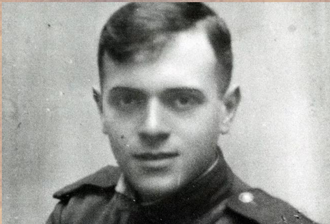
Давид Самуилович Самойлов (1920–1990)